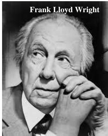
Frank Lloyd Wright